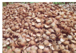
Harvested Coconut Shells