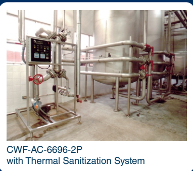
CWF-AC-6696-2P with Thermal Sanitization System