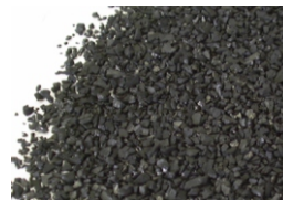
Granular Activated Carbon